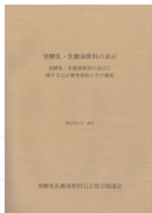
公正競争規約解説書

公正競争規約及び同施行規制の一部変更に伴い、条文の解釈や表示方法などを示した解説書やQ&A集の改訂版を発行しています。