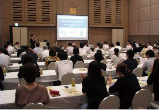
食品表示セミナー

関係省庁の担当官や外部の専門家を招き、関係法令や基準などに関する「食品表示セミナー」、また会員の表示担当者を対象とした「表示勉強会」等を開催し、公正競争規約制度の普及・定着を図っています。