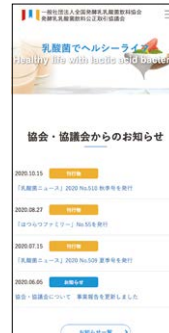
ホームページ(スマートフォン画面)